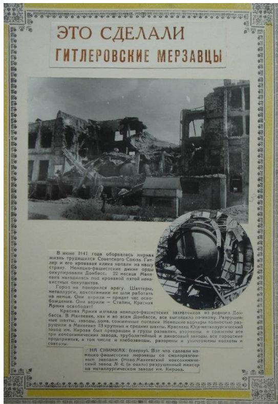
Страница из альбома «Макеевка. Ко второй годовщине освобождения Донбасса от немецко-фашистских захватчиков»

Такие фотоальбомы создавались и в других регионах Советского Союза, которые были в оккупации. В них также представлены фотоматериалы с описанием ущерба, нанесенного нацистами.