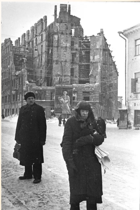
Жители блокадного Ленинграда на улице. На заднем плане на стене дома — плакат «Смерть детоубийцам». Зима 1941—1942 г.