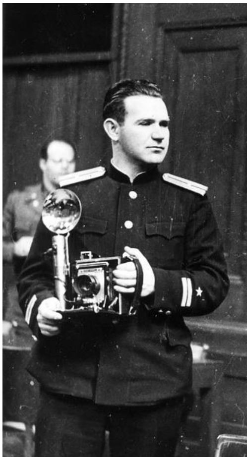
Евгений Халдей на Нюрнбергском процессе, 1945 год

В 2024 году Всероссийский онлайн-конкурс интерактивных фотоальбомов «Без срока давности» проводится впервые. Конкурсу присвоено имя выдающегося советского фотографа и военного корреспондента, уроженца Донбасса Евгения Ананьевича Халдея, прославившегося как автор всемирно известных серий снимков «Знамя Победы над рейхстагом», «Парад Победы», «Нюрнбергский процесс», «Освобожденные из гетто», «Освобождение Болгарии», «Под Веной», «Первый день войны» и других. Его фотография «Еврейская семья, освобожденная из будапештского гетто» была признана за рубежом и в 1945 году напечатана на страницах газеты «Times». На Нюрнбергском процессе снимки