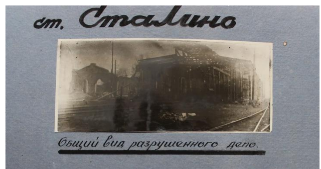
Страницы из альбома о зверствах нацистских оккупантов в Донбассе