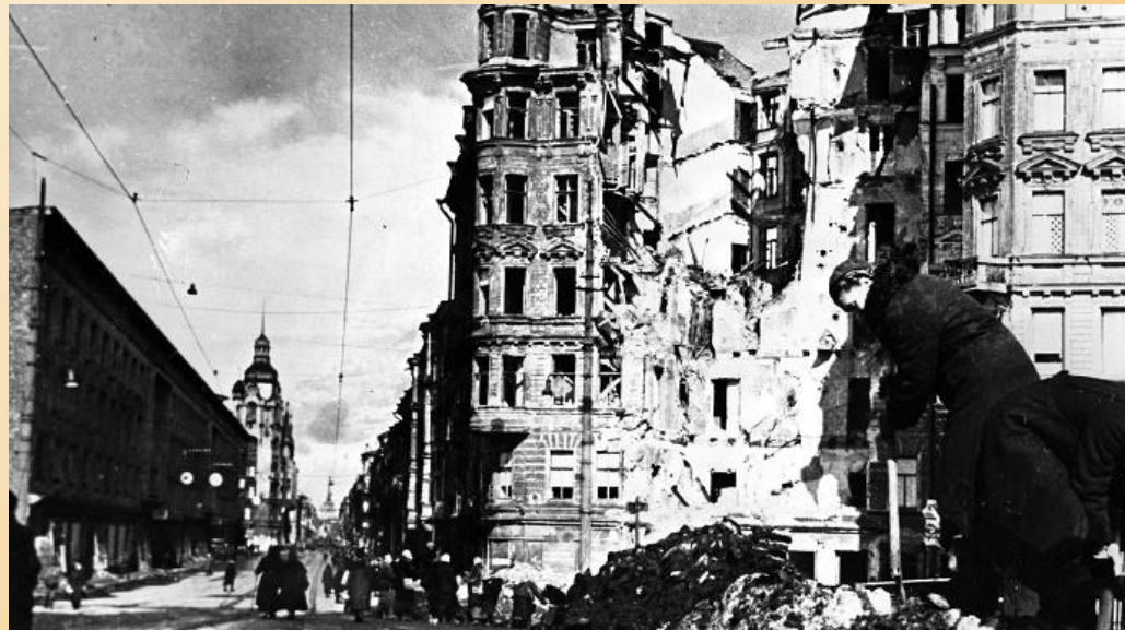
На улицах блокадного Ленинграда. Март 1943 г.