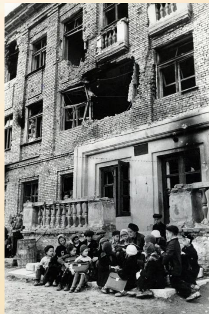
Учитель А.С. Дубровская со своими учениками около разрушенного здания школы. Ленинград, Фрунзенский район, 1942 г.