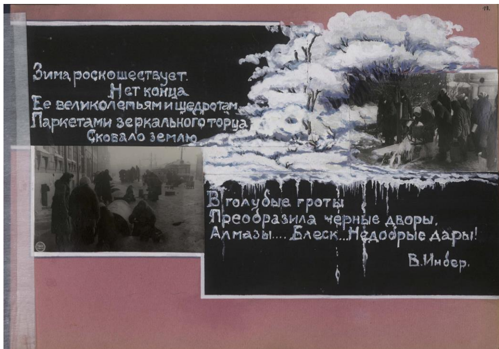
Страница из альбома «Ленинград в блокаде» З.Н. Косичкиной-Богословской

Такие фотоальбомы создавались и в других регионах Советского Союза, которые были в оккупации. В них также представлены фотоматериалы с описанием ущерба, нанесенного нацистами.