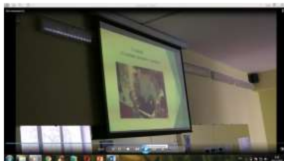
5 станция «Домашнее задание»