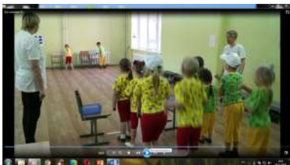
6 станция «Мамины помощники»