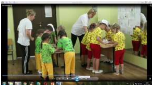
4 станция «Разрезные картинки»