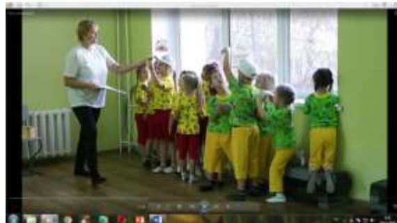
3 станция «Загадки»