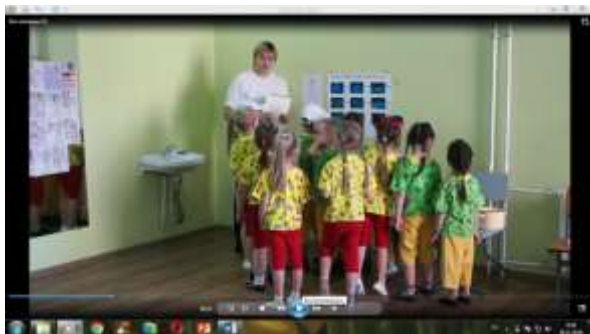
2 станция «Викторина»